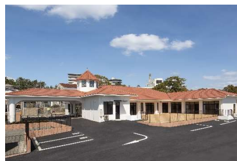
福岡東子ども発達センター・さくら園